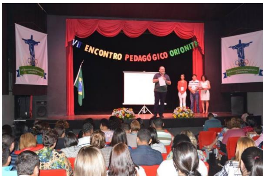
VII Incontro Pedagogico Orionino - Ufficio Stampa Opera Don Orione

1 AGOSTO 2016 • REDAZIONE • CHIESA E RELIGIONE